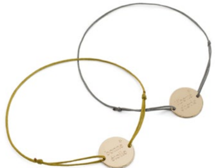
BRACELET MEDAILLE, 55€

Bureau de Presse FRANCE – JEAN-MARC FELLOUS 25, rue du Mail – 75002 PARIS Contact : Damien Nicolas +33 (0)6 07 76 96 15 damien@jeanmarcfellous.com