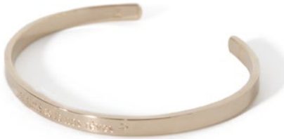
BRACELET JONC, 95€