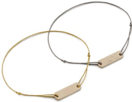
BRACELET GOURMETTE, 45€

Twistant les codes de la mode sans contrainte, cette collection capsule exclusive s'amuse avec des messages décalés chers à la marque et à la créatrice, au travers d'un sautoir chaîne, un ras de cou, un jonc et deux bracelets cordon, le tout en finition plaqué or 18k.